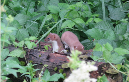
Junge Hermeline spielen auf einem Asthaufen im Kaltbrunner Riet.

Mit etwas Glück trifft man im Kaltbrunner Riet auf das scheue Hermelin. Auf der Suche nach Wühlmäusen hastet der flinke Jäger von Versteck zu Versteck, um nicht selber erbeutet zu werden. Nebst mausreichen Jagdgebieten braucht das Hermelin vor allem Strukturen, wie Hecken, Krautsäume, Gräben oder Asthaufen, die ihm Unterschlupf und geeignete Hohlräume für die Jungenaufzucht bieten.