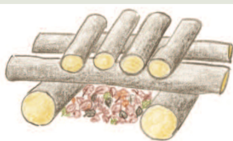
Die Aufzucht-kammer für Hermeline wird blockhausartig mit Starkholz aufgebaut.