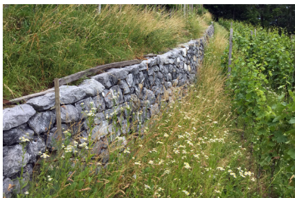
Trockenmauer mit Krautsaum in der Porta Romana.