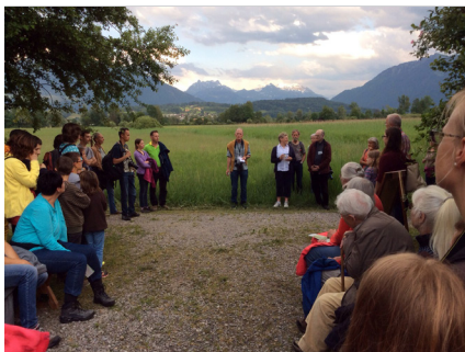
Nacht der Frösche am Riettag im Kaltbrunner Riet.

Für dieses grosse Engagement für die Öffentlichkeitsarbeit bedankt sich Pro Natura St. Gallen-Appenzell bei allen Beteiligten ganz herzlich.