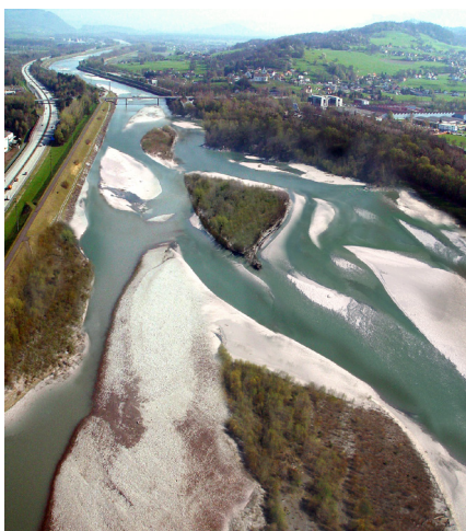
Hochwasserschutzprojekt Rhesi: Wie wir uns den Rhein wünschen (leider nur eine Fotomontage).

Die Auswirkungen des revidierten und 2014 in Kraft gesetzten Raumplanungsgesetzes beschäftigten uns intensiv. Diese Revision wurde vom Parlament als Gegenvorschlag zur Landschaftsinitiative erarbeitet. Viel Engagement verlangte auch das Hochwasserschutzprojekt Rhesi. Des Weiteren mussten wir im Jahr 2015 17 neue Rechtsfälle eröffnen und 3 Entscheide von Gemeinden zu Rechtsfällen an die Rekursbehörde weiter ziehen. Insgesamt konnten wir 20 Fälle abschliessen, 20 Rechtsfälle sind noch pendent.