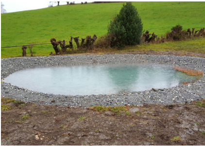
Neuer Weiher als Ersatzbiotop für einen Feuerweiher in Wald/AR.

Zwei der abgeschlossenen Rechtsfälle betrafen Rodungsgesuche im Zusammenhang mit Terrainaufschüttungen. Während in einem Fall in Heiden AR zu viel Aushub auf eine reguläre Deponie gebracht wurde (Aushub rutschte deshalb in ein bewaldetes Bachtobel), wurde im anderen Fall (Gemeinde Urnäsch) eine bewilligte Bodenverbesserungsmassnahme illegal ausgenutzt und zu viel Aushub zugeführt. Auch hier rutschte das überfüllte Terrain ab und verschüttete ein Waldstück. Beide Rodungsgesuche wurden nicht bewilligt und die Verursacher wurden verpflichtet, den Schaden zu bereinigen.