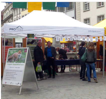
Lancierung des Projekts «StadtWildTiere»: Pro Natura am Ökomarkt.

Zum Kaltbrunner Riet verfassten wir wie jedes Jahr einen separaten Tätigkeitsbericht, der auf unserer Homepage «www.pronatura-sg.ch» publiziert ist oder auf der Geschäftsstelle bestellt werden kann (071 260 16 65).