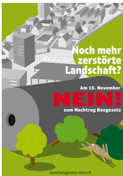
Auch dieses Plakat verhalf uns zum Erfolg. (Plakat: Komitee «www.baugesetz-nein.ch»)