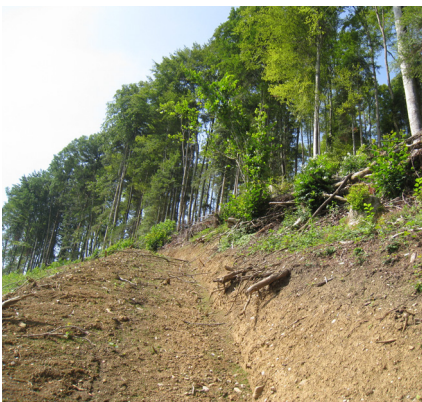
Der Maschinenweg Schuepis musste zurückgebaut werden, da er den angrenzenden Wald zu stark schädigte (freigelegte Wurzeln).

Ein ähnlicher Fall ereignete sich im Vorjahr auch in Untereggen. Dort entschied der Gemeinderat, dass die Überschüttung eines eingedolten Gewässers nicht bewilligt werden kann, verzichtete aber auf eine Verfügung zur Wiederherstellung des rechtmässigen Zustandes. In diesem Falle erhoben wir beim Kanton Rekurs.