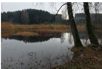
Schaffung einer Flachwasserzone im Schutzgebiet Moosweiher.

...inklusive aller Projektberichte sind zu finden unter « www.pronatura-sg.ch/aktuelle_projekte » und auf « www.pronatura-sg.ch/abgeschlossene_projekte ».