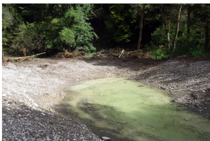
Flutmulde im Flussraum der Glatt beim Wilenholz.