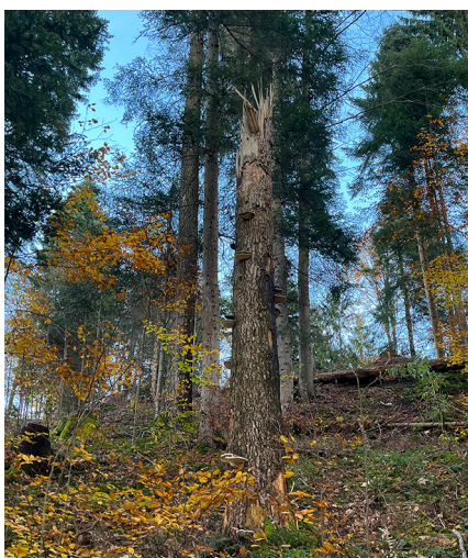
Schutzgebiet Bechtenwald (Mosnang SG): Totholz wird gefördert.

gieanlagen in den kantonalen Richtplan aufgenommen. Dadurch werden in den nächsten Planungsschritten vertiefte Abklärungen, insbesondere zu Natur und Landschaft, möglich. Darum unterstützte Pro Natura St. Gallen-Appenzell diese Festlegung medial und mit einer Kundgebung vor der Abstimmung im Kantonsrat.