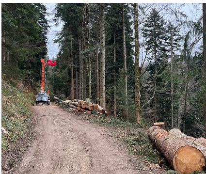
Im steilen Bechtenwald kommt eine mobile Forstseilbahn zum Einsatz.