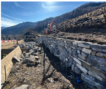
Trockenmauersanierung im Rebberg Freudenberg (Bad Ragaz SG) im Februar 2025.