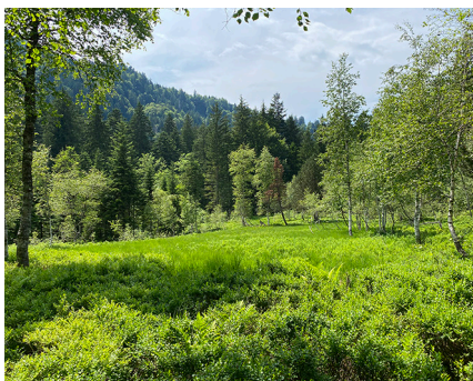
Hochmoor Vorderwängi (Kaltbrunn SG).