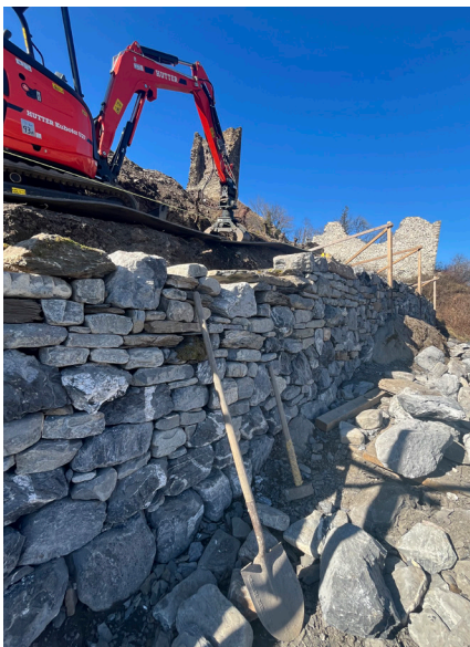
Trockenmauersanierung im Rebberg Freudenberg (Bad Ragaz SG) im Februar 2025.

...inklusive aller Projektberichte sind zu finden unter « www.pronatura-sg.ch/unsere-projekte » und auf « www.pronatura-sg.ch/abgeschlossene-projekte ».