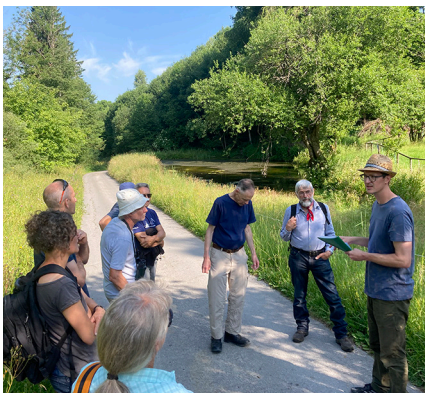
Exkursion der Kantonalgruppen AR/AI zum ehemaligen Sägeweiher Bach (Trogen AR).