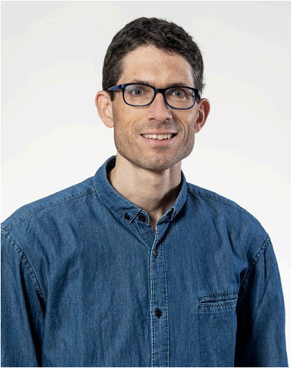
Jon Gaudenz, zurücktretendes Vorstandsmitglied (im Vorstand von 2020 bis 2026).