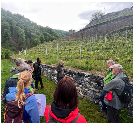
Exkursion des 365er-Clubs im Schutzgebiet Freudenberg (Bad Ragaz SG).