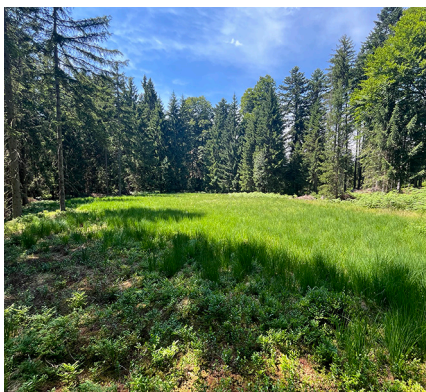
Neue Hochmoorparzelle im Schutzgebiet Salomonstempel (Ebnat-Kappel/Neckertal SG).