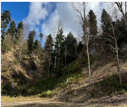
Feuchte Waldwiese unterhalb eines Felsens im Bechtenwald.