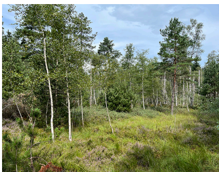
Hochmoor Rotmoos (Degersheim SG).