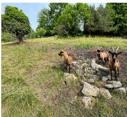
Beweidungsversuch mit Ziegen im Schutzgebiet Burghügel (Au SG).

Auch im Schutzgebiet Rachlis (Mosnang SG) wurde die Waldauflichtung zur Förderung lichtbedürftiger Arten weitergeführt. Zudem führten wir die Trockensteinmauersanierung im Rebberg Freudenberg in Bad Ragaz (SG) fort. In der dreijährigen Etappe 2023-2025 werden rund 195 Meter Trockensteinmauern saniert und ergänzende ökologische Aufwertungsmassnahmen wie Magerwiesen, Krautsäume, Gehölzpflanze und Nisthilfen umgesetzt, um den ökologischen Wert des Rebbergs zu erhöhen.