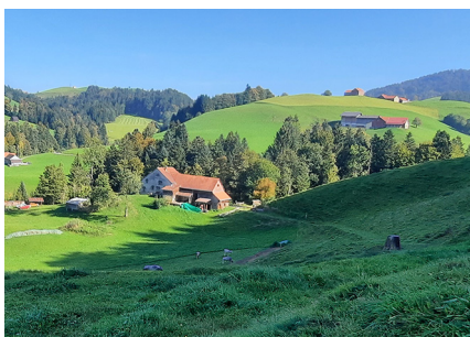
Neues Schutzgebiet Äschenwies (Schwellbrunn AR).