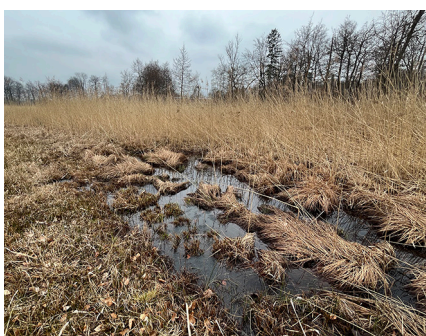
Amphibienlaichgewässer am Rand des Egelsees (Sennwald SG).